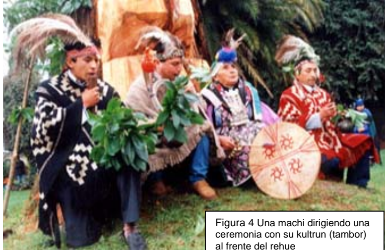
Figura 4 Una machi dirigiendo una ceremonia con su kultrun (tambor) al frente del rehue

En el mito de Fiura, los males, deformaciones y enfermedades causadas por la Fiura, serían prácticamente incurables y solo unos pocos casos pueden conseguir alivio mediante un tratamiento y ritual especial que pueden realizar únicamente las machis 12 . Para contrarrestar los males provocados por la Fiura se dice que se debe tomar raspaduras provenientes de la