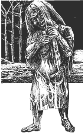
Figura 3 Fiura

ante una reconstrucción histórica, educativa, social y cultural, próxima a la anomia que Durkheim 7 nos presentaba como una de las causa del suicidio?