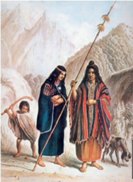
Figura 1 Familia Mapuche (Mapu=tierra, Che= gente). Claudio Gay, Atlas de la Historia Física y Política de Chile, París 1854

El admapu 1 (costumbre de la tierra) es el conjunto de tradiciones y costumbres antiguas, normas, derechos y leyes, que regulan el comportamiento del pueblo Mapuche. El conocimiento de éste se establecía a partir de los 12 años en las mujeres y de los 14 en los hombres, el admapu regiría la moral, la religión, la espiritualidad y la legalidad del territorio mapuche. Determinaba, en una palabra, la identidad de este pueblo, así nos deja ver a través del admapu, la interacción respetuosa del hombre con la naturaleza, la importancia de los antepasados como guías espirituales, derechos y deberes sobre la tierra y la organización socio-política, endo y exo grupal y el papel de la guerra con otros pueblos.